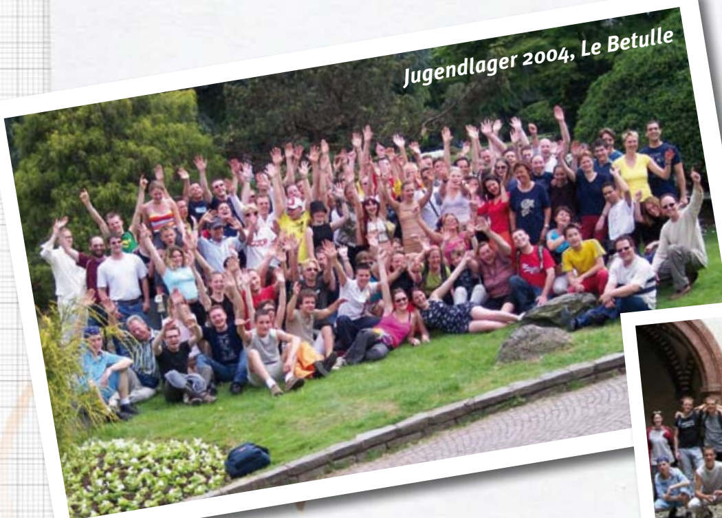
Jugendlager 2004, Le Betulle

Die Kontonummer zur Einzahlung der Teilnehmerbeiträge wird NACH der Anmeldung an die Kontaktperson übermittelt.